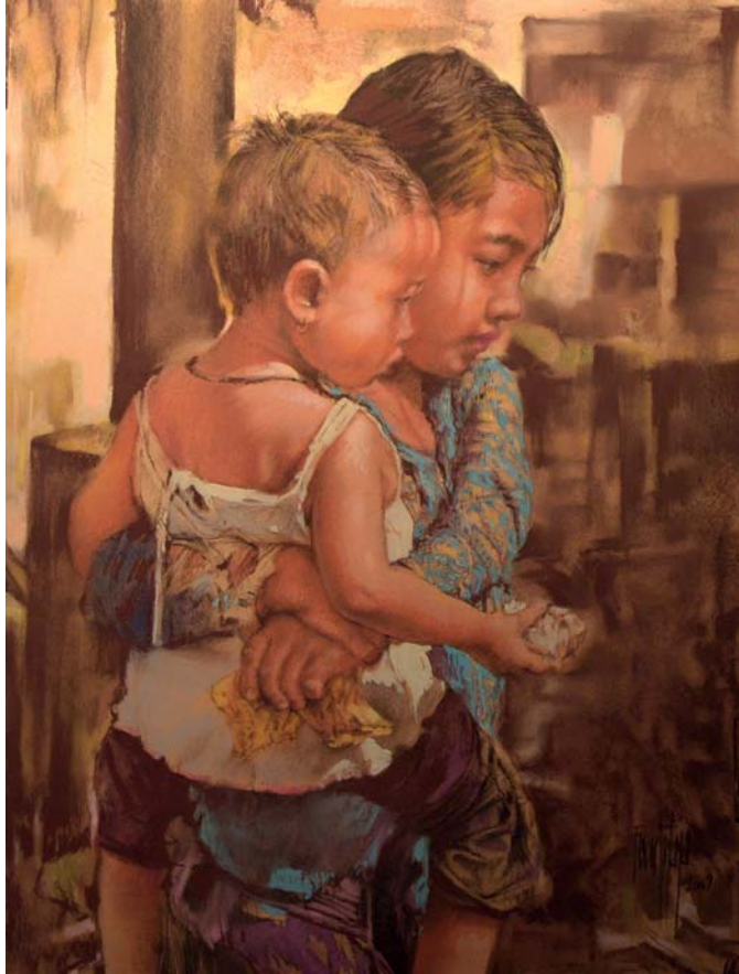
Niños 65 x 50 cm. Pastel sobre cartón