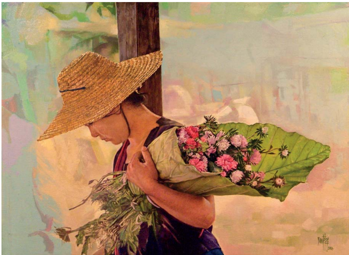
En el mercado. Lago Inley. Birmania. 83 x 115 cm. óleo sobre lienzo